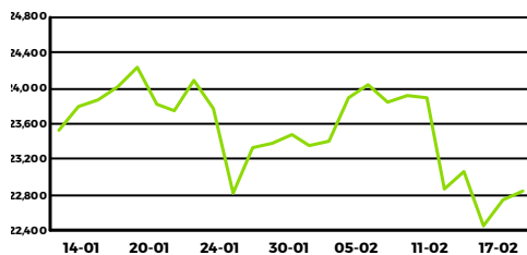
Índice de Bonos IAMC- \$